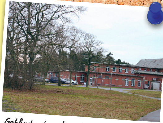
Gebäude der ehemaligen Nordheimstiftung

Außerdem soll der Oberbürgermeister im Rat der Stadt über den Sachstand von Gesprächen und Initiativen berichten, die seitens der Stadt unternommen wurden, um eine umfassende Hilfeleistung für Flüchtlinge sicherzustellen.